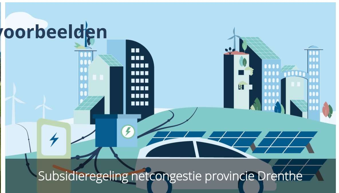
Subsidieregeling netcongestie provincie Drenthe