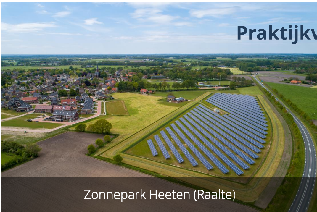
Zonnepark Heeten (Raalte)