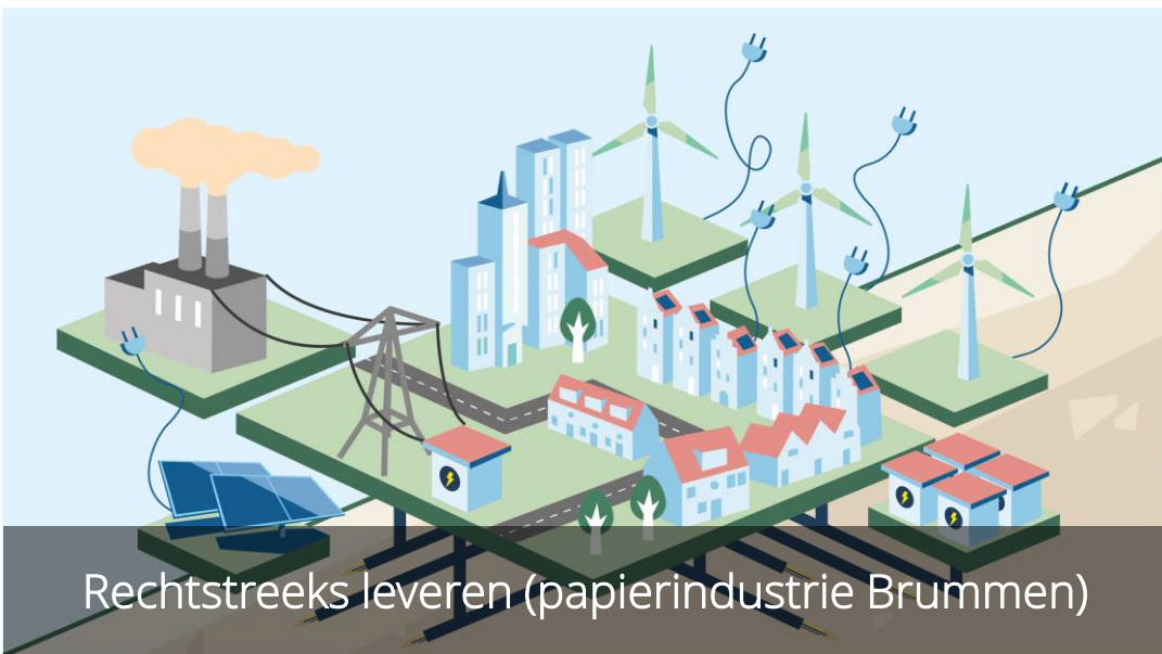
Rechtstreeks leveren (papierindustrie Brummen)